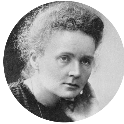
Foto: Wikimedia commons/Fotograv.-Generalstabens Litografiska Anstalt Stockholm, 1911 (Ausschnitt)

Ich glaube, dass die Fähigkeiten, die eine wahre wissenschaftliche Berufung verlangt, unendlich kostbar sind.